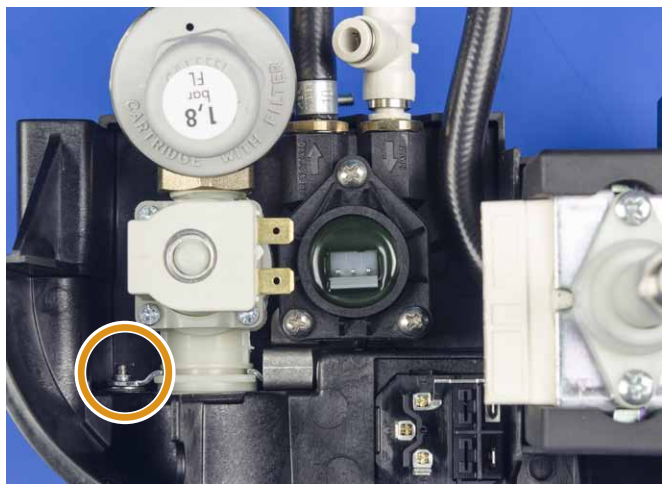
Compteur volumétrique monté