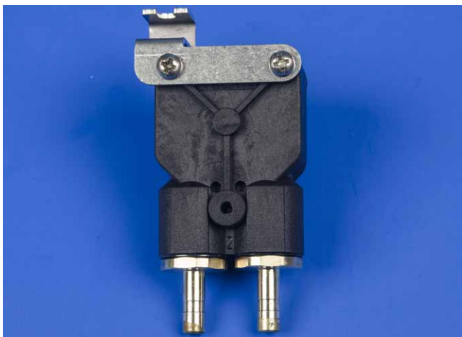
Assemblage des pièces du set du compteur volumétrique