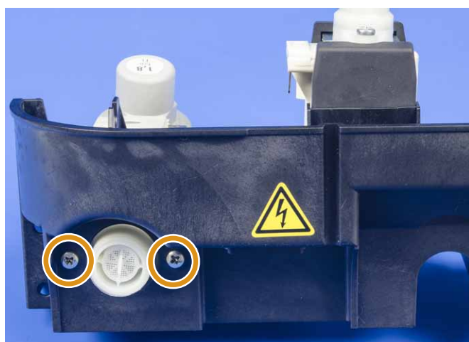
Vis du raccord d'eau fixe