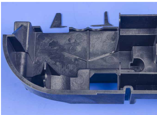
Cadre d'angle sans pattes de maintien