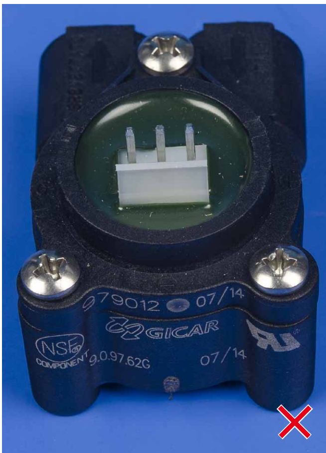
Compteur volumétrique 33.2263.8000

AVIS Vous pouvez commander le set de pièces détachées - compteur volumétrique auprès du service commercial SAG en indiquant le numéro de référence 074355.