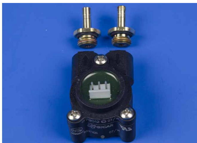
Ancien compteur volumétrique avec raccords à visser et joints toriques démontés