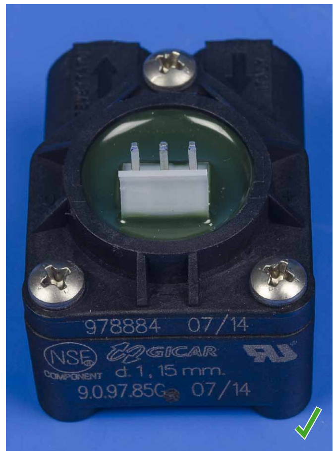
Compteur volumétrique 074355