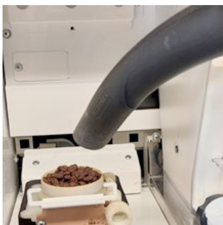
Verwijder de bonen boven op de molen. U kunt dit handmatig doen, of met een stofzuiger.