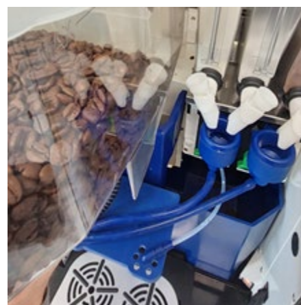
Verwijder de bonenhouder. Til deze iets op, en vervolgens naar voren uit de machine.