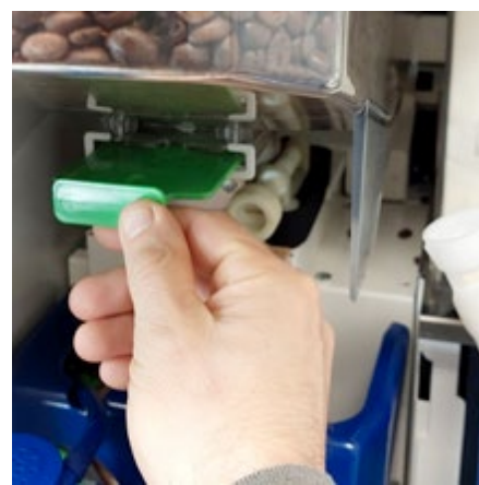
Plaats de bonenhouder weer terug, trek de groene schuif naar voren, en sluit de machine.