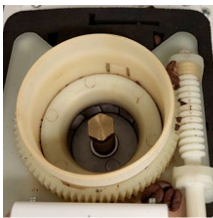
Controleer of er een ongewoon object (bijv. een stukje verpakking) tussen de maalschijven is beland, en verwijder dit indien mogelijk.